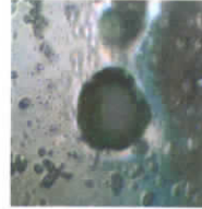
Wasser, belastet durch Funkwellen wie Handy, WLAN und Satellitentelefon

Bedenken Sie: Elektrosmog und vor allem die gepulsten Hochfrequenzen machen auch vor der Regenwolke nicht Halt. Linkspolarisierter Regen fällt auf die Erde und bewässert unsere Nahrung.