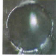
Wasser, belastet durch Elektrosmog wie Strom, Mikrowelle