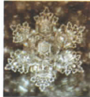
Reines, unbelastetes Trinkwasser

Wichtig zu wissen ist, dass Wasser ein „Gedächtnis“ hat. Es kann Informationen aufnehmen, speichern und gibt diese Informationen weiter. So speichert Wasser die Informationen von allem, mit dem es in Berührung kommt: positive Informationen aber auch Informationen von Arzneimitteln, Rückständen, Umweltgiften, Pestiziden, Elektrosmog, Handy- und Satellitenstrahlung und Informationssmog.