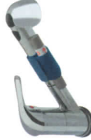
Reiseanlage mit praktischem Klettverschluss – auch für den Singlehaushalt € 250,00

Zusätzlich wird Ihr Leitungswasser mit freier Lebensenergie angereichert. Die Clusterbildung wird erhöht. Ihr Leitungswasser wird mit dem Durchlauf-Impuls-Generator in Harmonie gebracht.