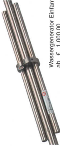
Wassergenerator Einfamilienhaus ab € 1.000,00

Mit dem Pen-Yang-Durchlauf-Impuls-Generator erhält Ihr Leitungswasser die lebensnotwendige Energie zurück, die bei der heutigen, modernen Wasseraufbereitung verloren geht.